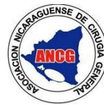
Asociación Nicaragüense de Cirugía General. (ANCG)