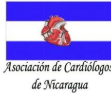
Asociación de Cardiólogos de Nicaragua