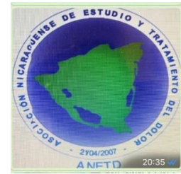
Asociación Nicaragüense de Estudio y Tratamiento del dolor