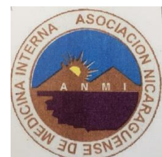
Asociación Nicaragüense de Medicina Interna