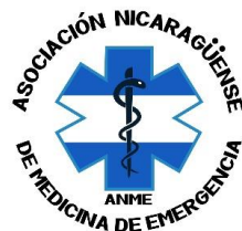
Asociación Nicaragüense de Medicina de Emergencia