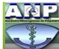
Asociación Nicaragüense de Psiquiatría (ANP)